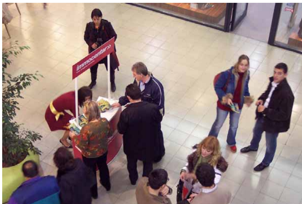
Veliko interesovanje za vino "Vizantija"